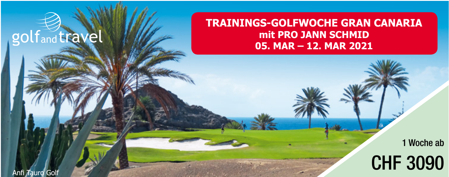
Anfi Tauro Golf